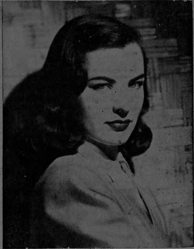
El cutis de ELLA RAINES es, según Max Factor Jr., una prueba evidente del glamor que presenta un color tostado adquirido gradualmente.